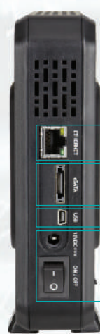
Rückseite NetDISK mit Anschlussmöglichkeiten